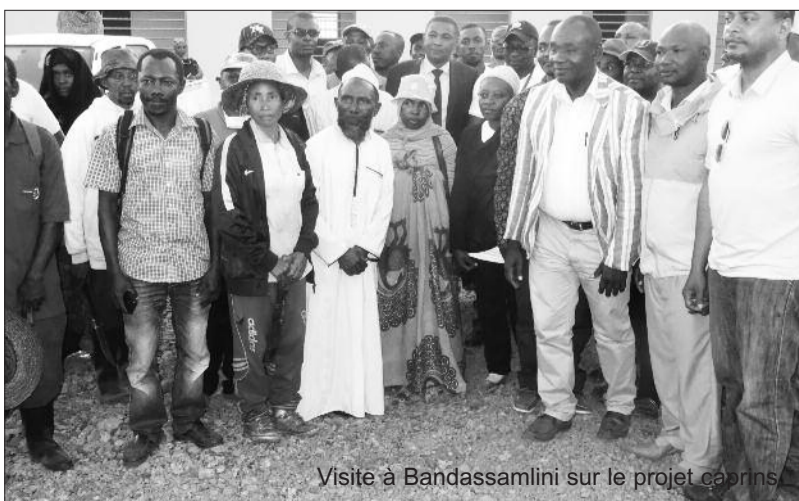
Visite à Bandassamlini sur le projet caprins